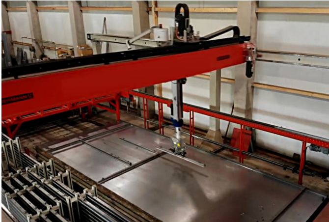
Güdel Portal legt einen Schalungselement auf die Grundplatte