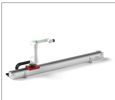
Bodenverfahrachse CoboMover CMF mit Fanuc Cobot CRX-10iA

Auch logistische Aufgaben wie Verpacken und Palettieren sind mögliche Einsatzgebiete. Der CoboMover ist ein guter Partner für Montagearbeiten und Oberflächenbearbeitung. Güdel hat die siebte Achse für Cobots von Grund auf neu konzipiert und mit über 70 Jahren Erfahrung im Bereich der Lineartechnik ein sicheres und zuverlässiges Produkt auf den Markt gebracht. Sollte dennoch einmal etwas nicht zufriedenstellend sein, hilft unser weltweiter Service gerne weiter.